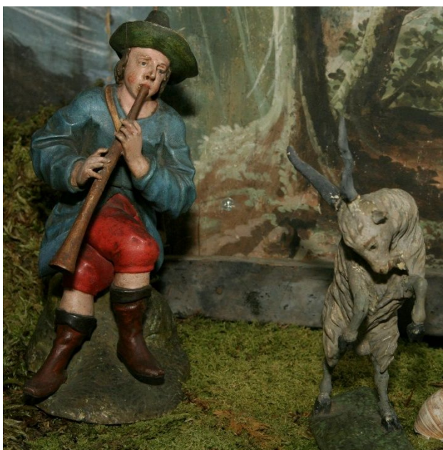
Schalmei spielender „Juchheißa“ mit tanzendem Bock