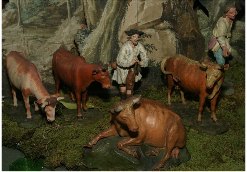
Hirten mit Schafen und Rindern