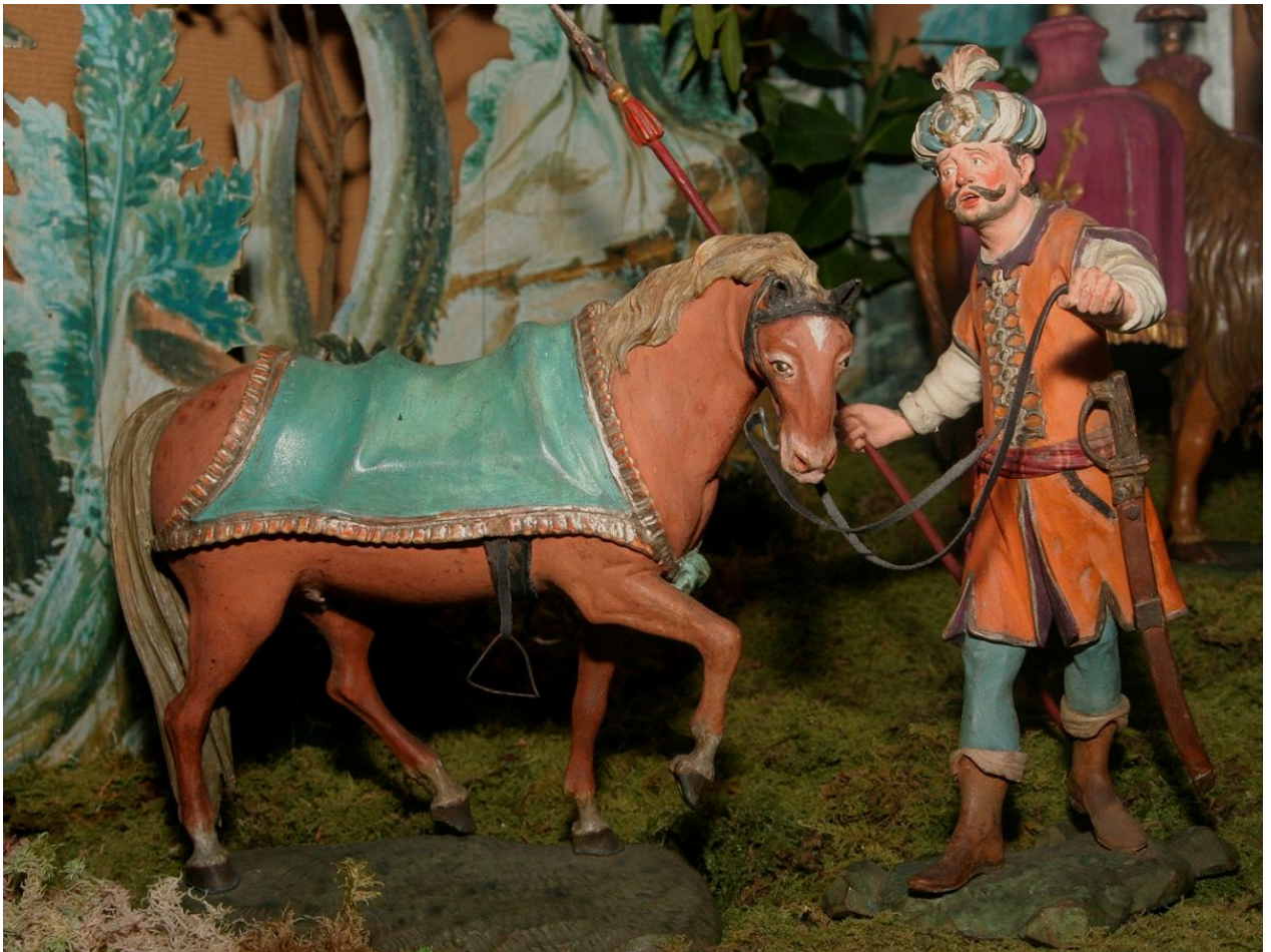
Einer der drei Rossknechte mit Fuchs