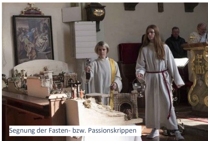
Segnung der Fasten- bzw. Passionskrippen

Fasten- oder Passionskrippen sind Krippen, die das Leiden und Sterben Jesus Christus darstellen. Die „Ernste Krippe“, wie sie auch oft genannt wird, umfasst die Kirchenjahreszeit, vom Palmsonntag bis Ostermontag. Ebenso wie die Weihnachtskrippe geht die Entstehung der Fastenkrippe in die Zeit des frühen Mittelalters zurück. Besonders gefördert wurde sie von den Jesuiten in der Zeit der Gegenreformation. Die Idee von der Darstellung des Heiligen Grabes dürfte wohl von den Teilnehmern der Kreuzzüge stammen. Zuerst standen die Fastenkrippen nur in den Kirchen und Klöstern, ab dem späten 18. Jahrhundert dann auch in Privathäusern. Fastenkrippen stellen szenisch die Passion Christi dar und stehen vor allem eng mit dem geistlichen Schauspiel der Barockzeit in Verbindung. Beginnend mit dem Einzug in Jerusalem am Palmsonntag werden die einzelnen Geschehen gereiht, bis zur Kreuzigung, manchmal auch bis zur Auferstehung. Große Fastenkrippen sind meist aus Holz geschnitzt oder ausgesägt. Zur Aufstellung in den privaten Häusern wurden häufig Papierkrippen geschaffen. Sie wurden von bekannten Künstlern gezeichnet oder gemalt ( die Fastenkrippe von Götzens/Tirol mit über 250 Figuren, gezeichnet von Georg Hallers 1772 – 1838 ), dann in großer Auflage als Ausschneidebögen verlegt. Die Landesobfrau von Steiermark hatte 2015 mit den Mitgliedern ihres Krippenbauvereins als Gemeinschaftsarbeit eine rund vier Quadratmeter große Fastenkrippe für die Pfarre der Gemeinde Grafendorf Stmk geschaffen.