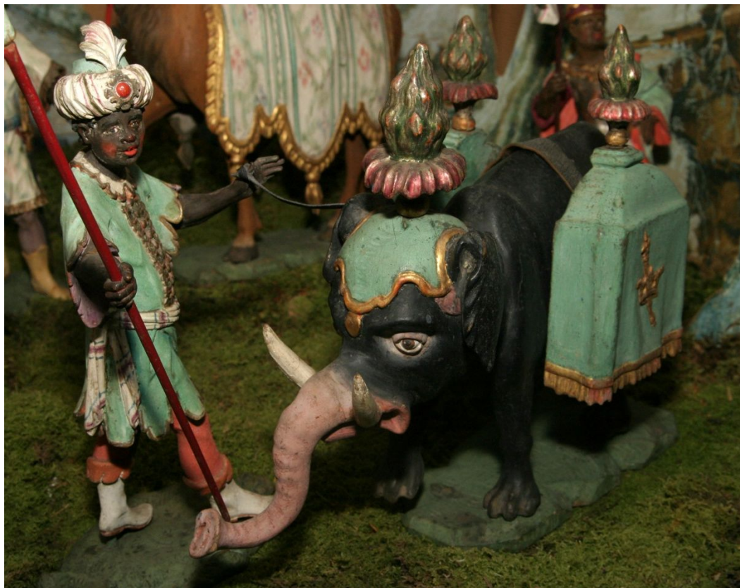
Elefant mit Truhen beladen; er weist vom Körperbau einige Merkmale anderer Tiere auf