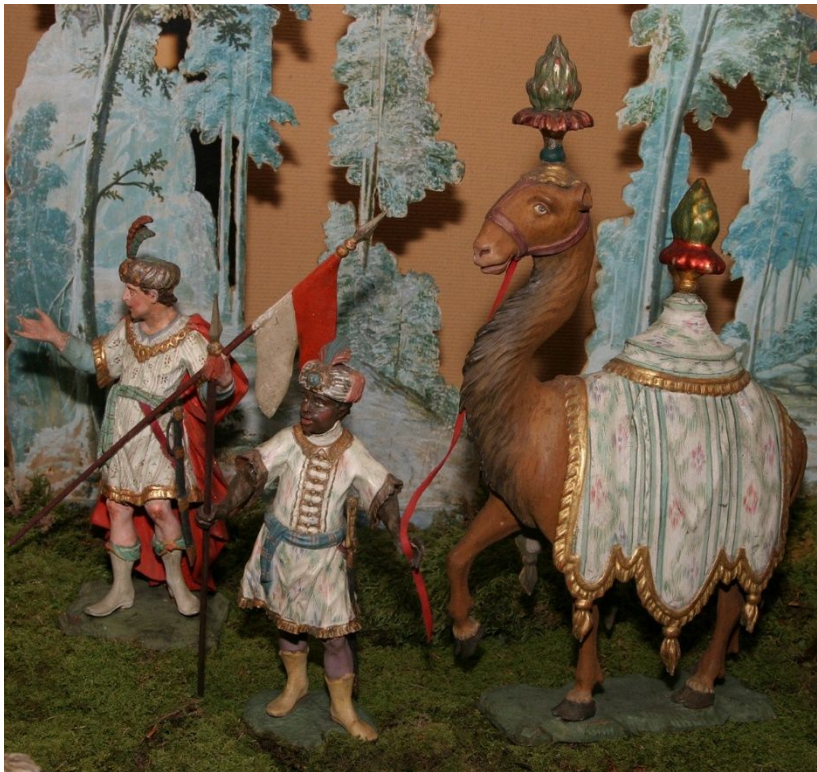
Dromedar; in der Krippe befindet sich weilers ein zueihöckriges Kamel