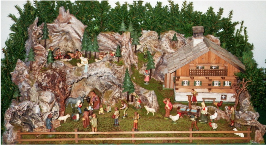
Bad Ischler Krippenfreunde