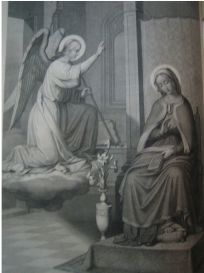
Maria Verkündigung 25. März