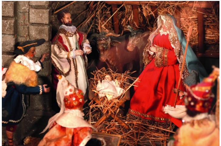
Geburtsgrotte mit den restaurierten Figuren

Hier absolvierte Franz Xaver Gruber seine Ausbildung zum Lehrer i an „Trivialschulen“. ii Sein Reisepass nach Ried war vom Pfliegericht Wildshut am 30. April 1806 ausgestellt worden, was auf einen fast dreimonatigen Aufenthalt Grubers in Ried schließen lässt. iii Das am 22. Juli 1806 ausgestellte Zeugnis gibt einen Einblick in die Lehrerausbildung zu Beginn des 19. Jahrhunderts: „Vorzeiger dieses Herr Konrad Xaver Gruber von Hochburg aus dem Innviertel hat dem für Triviallehrer vorge-