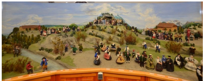
Mittelteil der OÖ. Landeskrippe

Die Steilabstürze zur Donau leiten in das Mühlviertel über, im Hintergrund der Böhmerwald, Stift Schlägl, Burg Waxenberg und Schloss Weinberg, im Talgrund die Wallfahrtsdarstellung, auf der Anhöhe Sonnwendfeuer, im Vordergrund der Steinbruch, auf den Pöstlingberg gehen die Gaben-