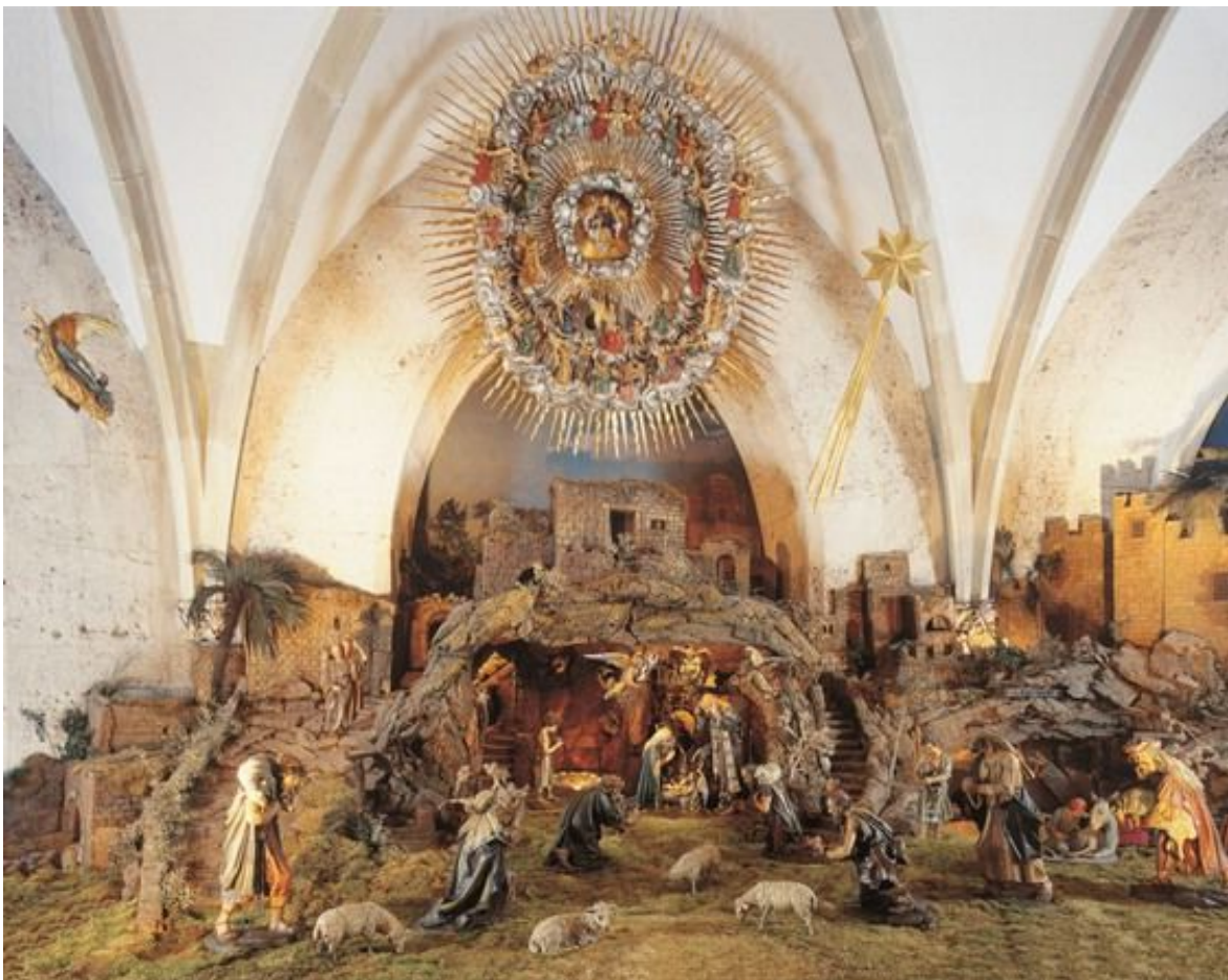
Linzer Domkrippe, auch Osterriederkrippe genannt

Auch eine theologische Deutung wurde in das Geschehen miteinbezogen: Über Maria und dem Kind schweben drei Engel mit Kreuz, Dornenkrone und Kelch als Symbol für das spätere Geschick und Leben dieses Neugeborenen. Oben hängt ein großer Strahlenkranz mit musizierenden Engeln als Darstellung des Himmels. Christus kam vom Vater, lebte als Mensch, ist gestorben und zum Vater erhöht worden. So ist eigentlich in dieser Krippe nicht nur das Weihnachtsgeschehen dargestellt, sondern durch die Symbolik das ganze Christugeschehen.