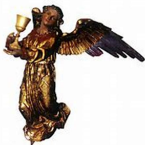
Engel mit dem Kelch

Der Stall, in dem sich Ochs und Esel befinden, ist von der Heiligen Familie durch je einen senkrechten und waagrechten Holzbalken getrennt, mit denen die Höhle offensichtlich abgestützt werden soll. Diese beiden Balken ergeben klar die Form eines Kreuzes.