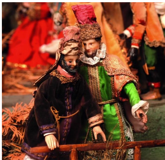
Zwei Königspagen im neuen Gewand

Bevor Gruber nach Ried gekommen war, hatte er schon mehrere Monate als Schulhilfe in Hochburg bei seinem ehemaligen Lehrer Andreas Peterlechner (1766-1836) absolviert, der seine musikalische Entwicklung sehr förderte. Durch die in Ried abgelegte Prüfung erwarb er die Berechtigung für eine österreichische Anstellung. Um seinen ersten Dienstposten als Lehrer im salzburgischen Arnsdorf antreten zu können, musste Gruber eine Art „Nostrifizierungsprüfung“ ablegen. Neben seiner Schulmeistertätigkeit hatte er auch noch Organistendienste im nahen Oberndorf zu erfüllen. Am 24. Dezember des Jahres 1818 übergab der Hilfspriester Joseph Mohr sein bereits zwei Jahre vorher entstandenes Gedicht „Stille Nacht, Heilige Nacht“ mit der Bitte dazu zwei Solostimmen mit Chor und Gitarre Begleitung zu schreiben. Die Uraufführung fand nur wenige Stunden später bei der Christmette vor der Kirchenkrippe statt.