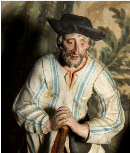
Zwei greise Hirten jeweils auf Stöcke gestützt. 5

zeigt das etwas vorseilende, ungeduldig ziehende Kind, wie hier bei Johann Georg Schwanthaler, mit einer Hand in die Richtung des Stalles.