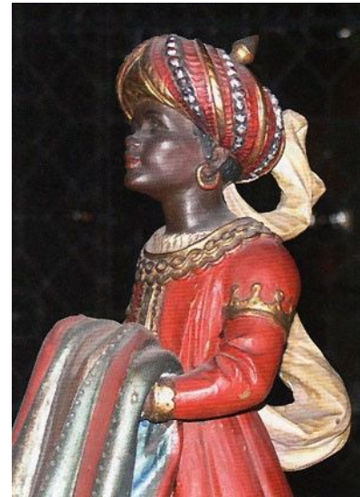
Page des dunkelhäutigen Königs

Nun wollen wir noch das Gefolge der drei Könige betrachten, welches Osterrieder ( neben dem Engelschor, von dem später noch die Rede sein wird ) als Letztes für unsere Domkrippe geschaffen hat. Nicht weniger als sieben Kamele, außerdem ein Elefant und ein Araberhengst samt Bereibern und Lenkern werden aufgeboten, um dem Beschauer ein möglichst farbiges Bild des Orients und seiner materiellen Kultur bieten zu können. Zeltstangen und -decken, Körbe, Flaschen und Trinkbecher, Kochpfannen und Geschirr, aber auch Waffen wie Speere und Wurfspieße und die dazugehörigen Köcher dürfen dabei nicht fehlen. Es ist ein schwieriger Spagat, der Osterrieder in Linz gelungen ist: Einerseits versuchte er mit seiner Krippe den Menschen des beginnenden 20. Jahrhunderts das Heilige Land mit seinen Bewohnern und seiner Kultur näherzubringen. Dabei verfiel er aber nicht in das Extrem, die Geburt Jesu lediglich als Vorwand zu gebrauchen, um dem Beschauer ein Spektakel mit phantastischen Landschaften und Gebäuden und einer Unmenge von malerisch gekleideten Personen und exotischen Tieren zu bieten. Osterrieders Krippe hat bei allen Superlativen, die sie uns zeigt, dennoch in erster Linie eine religiöse Funktion. Ist es da ein Wunder, dass die Besucher gerade in den ersten Jahren in Scharen zur Krippe kamen, um das Weihnachtsgeschehen von Bethlehem intensiv nacherleben zu können?