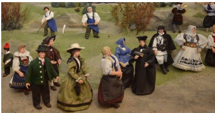
Tracht der Heimatvertriebenen und zwei Mäher im Hintergrund

Sudetendeutsche Trachten – Schönhengster Frauentracht: Leibchen ist aus grünen Samtbändern und Goldborten kunstvoll gefertigt. Den Fürsteck (Latz) zieren Perlen und Goldstickerei. Rock brauner oder schwarzer Wollstoff, blaue Schürze mit gelber Stickerei, Kopftuch – rotgemusterter Sax, rote Strümpfe.