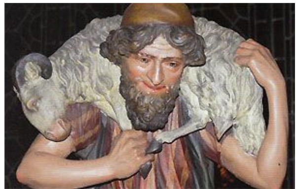
Schäfer in der Domkrippe

hinaus, um Wasser zu holen. Der Knabe ist gerade dabei, eine Weintraube zu verzehren. Woher aber wissen die Hirten, was sich in der Nacht in der Stadt Bethlehem ereignet hat? Das erfahren wir, wenn wir einen Blick nach links oben zum Himmel werfen. Dort schwebt der Verkündigungengel, eine prächtig bekleidete Figur. Er trägt ein langes, goldenes Gewand mit reicher Damaszierung sowie darüber einen blauen Mantel. Seine Flügel glänzen in goldenen und silbernen Farben. Mit seiner rechten Hand zeigt er auf die am Hirtenfelde ruhenden Schäfer; die Linke ist erhoben und weist auf den Stern, der