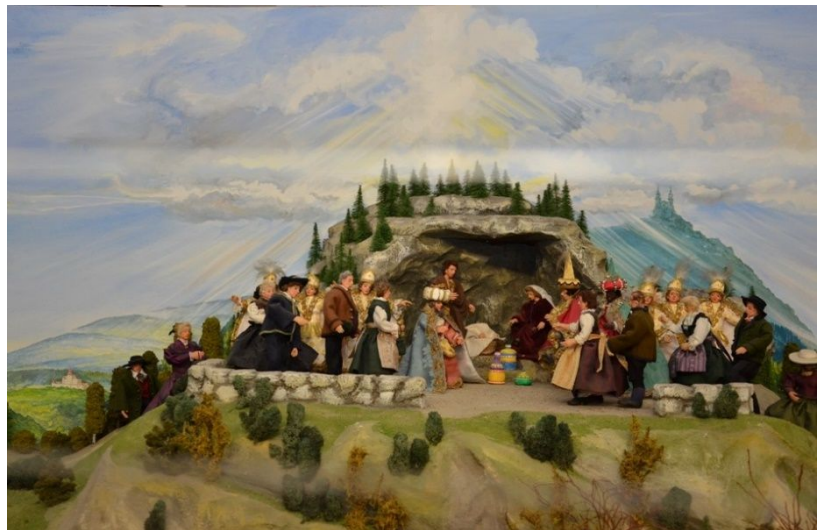
Geburtsgrotte mit den zahlreichen Gabenbringern

Hausruckviertler Männertracht: Aus der Zusammenstellung schwarzer Kniebundhose, blaue Strümpfe, bunte Weste und der dazu passende Rock. Die olivgrüne Farbe des Hausruckviertels hält die Mitte zwischen dem Goldbraun des Innviertels und dem grün der Alpenlandschaft.