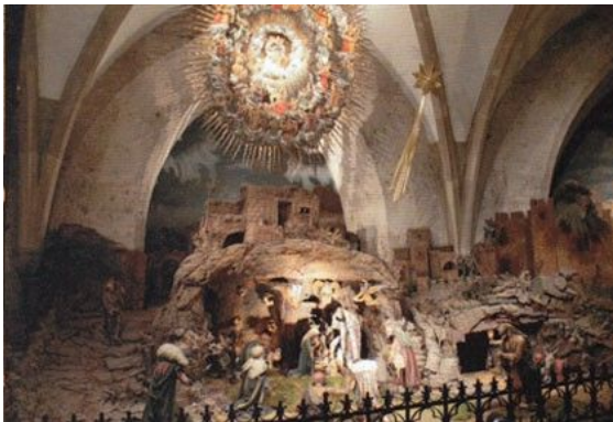
Weihnachtsdarstellung der Domkrippe

Die reichlich fließenden Spendengelder, die in den Jahren 1908–13 einlangten, gestatteten es dem Auftraggeber, bei Osterrieder eine Fülle von Krippenfiguren in Auftrag zu geben. Mehr als 50 Figuren und Figurengruppen hat der Münchner Meister für die Linzer Domkrippe geschaffen. Sie erreichen eine Höhe von bis zu einem Meter. Dabei hat der Künstler auch Rücksicht auf die Perspektive genommen: Figuren, die vom Betrachter aus weiter entfernt sind, wurden kleiner geschaffen; die im