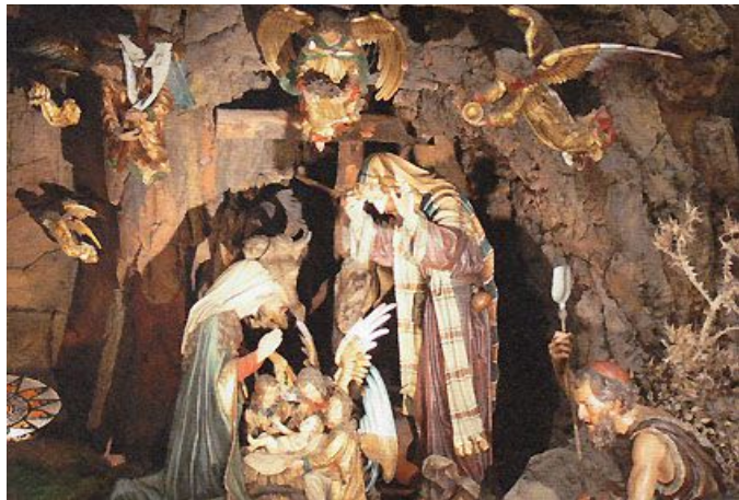
Krippengrotte mit weihnachtlicher Aufstellung

Während Maria weder durch ihr Aussehen noch durch ihren Gebetsgestus ( sie hat ihre Hände nach abendländischer Art gefaltet ) etwas Orientalisches anhaftet, wird Josef klar als Bewohner des Heiligen Landes geschildert. Er ist buntfarbig gekleidet, mit rötlich braunem Mantel, der an den Füßen mit Faltenspiel endet. Darüber trägt er einen langen, gestreiften Schal mit Quasten sowie ein helles Kopftuch. An seinem Mantelgürtel hängt eine Reiseflasche. Neben seinen Füßen, an denen er die in Palästina üblichen Sandalen trägt, steht ein Teller, worauf sich ein irdener Krug befindet. Josef betet im Gegensatz zu seiner Frau in Orantenhaltung mit ausgebreiteten, erhobenen Armen. Ernst und andächtig sieht auch er zu dem Neugeborenen hinab.