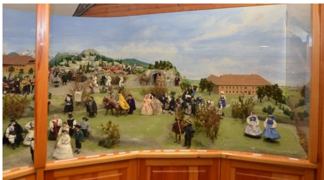
Rechter Teil der OÖ. Landeskrippe

Mit dem Dachstein im Hintergrund, dem Gmundner Liebstattonntag und den Ebenseer Glöcklern ist das Salzkammergut dargestellt. Der Almbtreib gilt für die ganze Gebirgsregion. Die Bergwerksgestaltung, ebenfalls stellvertreten für mehrere Viertel, leitet ins Traunviertel über, im Hintergrund Stift