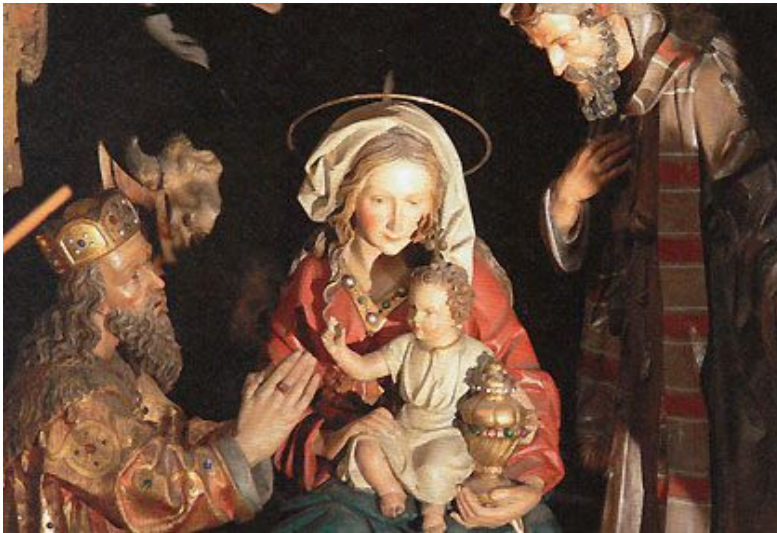
Anbetung der Hl. drei Könige bei dem am Schoße sitzenden Jesuskind

ria ist auch nicht mehr die ärmliche, schlicht gekleidete Frau, als die sie uns von der Weihnachtskonfiguration bekannt war. Aus ihr ist eine „Himmelskönigin“ geworden: Sie trägt ein rotes Kleid mit V-förmigem Ausschnitt, welches mit Gold eingefasst und mit Edelsteinen besetzt ist, und dazu einen kostbaren Gürtel. Ihren blauen Mantel hat sie als Unterlage für das Kind auf ihrem Schoß ausgebreitet; er fällt mit zahlreichen kaskadenförmigen Falten zu Boden und lässt dabei sein goldenes Innenfutter erkennen. Auch dieser Maria haftet – wie schon der Maria in der Weihnachtsgruppe – nichts Orientalisches an, sie ist vielmehr eine