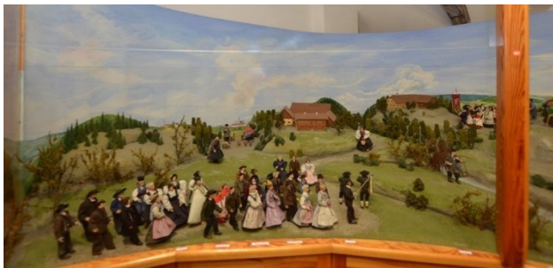
Linker Teil der OÖ. Landeskrippe

Die Krippenlandschaft der oberösterreichischen Landeskrippe kann mit keiner anderen Weihnachts-Großkrippe verglichen werden, weder in ihrer Form und Gestaltung noch vom verwendeten Material her. Galt es doch, mehrere Maßstäbe ( Landschaft, Hofformen und Figuren ) zu vereinen und den Übergang zur Panoramamalerei herzustellen. Weiters musste die eigentliche Krippenhöhle auf dem Pöstlingberg alles überragen. Die annähernden Höhendifferenzen der verschiedenen Landesteile mussten entweder im Aufbau oder in der Rückenwandmalerei berücksichtigt werden. Ein weiteres Problem war das Aneinanderreihen der Landesviertel. Verschiedene Stifte, Klöster, Schlösser, Burgen usw. konnten aus bautechnischen oder geografischen Überlegungen nicht berücksichtigt werden, ebenso mussten verschiedene Figurendarstellungen stellvertretend für mehrere Viertel aufgestellt werden.