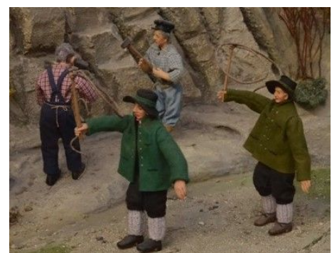
Zwei Aperschnalzer u. Steinbrucharbeiter im Hintergrund

Mühlviertler Kopftuchfrau: Als Kopftuchtracht in allen dunklen Farben erlaubt. Jackenkleid mit schwarzer Schürze, aufgesetzte