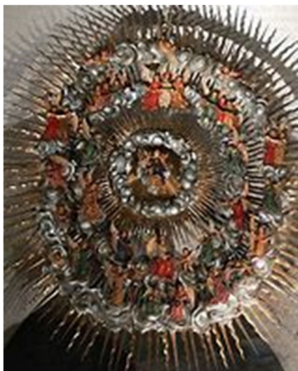
Engelschor der Domkrippe