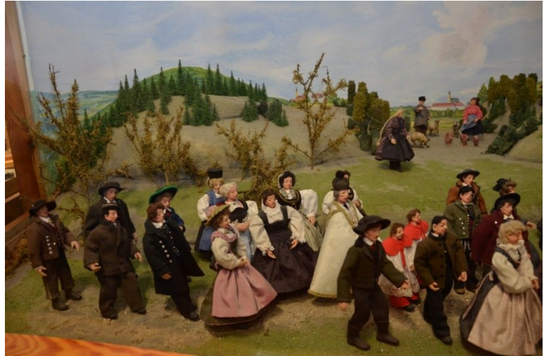
Rieder Hochzeitszug - Ende

Innviertler Anzug: Rock aus ockerbraunem Loden oder Kammgarn, schwarze Steppverzierungen auch auf der gleichfarbigen Hose.