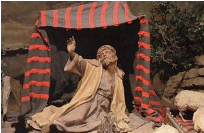
Hirte in der Domkrippe

über dem Krippenberg schwebt. Der Künstler hat hier die Evangelienstelle geschildert, in der der Engel den Hirten die Botschaft bringt: „Fürchtet Euch nicht, ich verkünde Euch eine große Freude!“ Drei der Schäfer, die die Engelsbotschaft soeben vernommen haben, werden von Osterrieder geschildert, wie sie auf unterschiedliche Weise darauf reagieren. Einer von ihnen muss sich nach dem Hören der Nachricht schon erhoben haben, doch der Anblick des himmlischen Boten hat ihn nochmals zu Boden geworfen. Mit dem Gesicht nach unten kauert er auf der Erde, seinen Kopf in den Händen vergraben. Sein neben