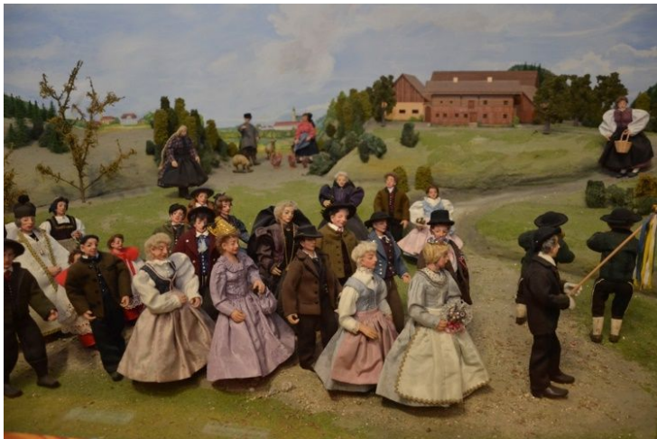
Rieder Hochzeitszug - Spitze

Ein Hochzeitszug aus der Umgebung von Ried im Innviertel beim Gang von der Kirche zum gemeinsamen Mahl. An der Spitze des Zuges marschieren die Bläser und der Bevollmächtigte des Hochzeitspaares, der