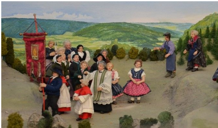
Wallfahrt im Mühlviertel

Zwei Musikanten – Pfarrer – Pilger und Pilgerinnen mit Blaudruckleibkittel - Bettzeugleibkittel: Blaudrucke und Bettzeugweben werden im Mühlviertel noch immer hergestellt. Aus diesem Materialien werden die beliebten Alltagstrachten und Leibkittel genäht.